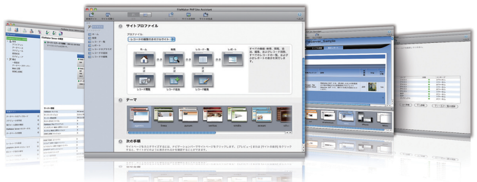
高速で信頼性に優れたサーバーソフトウェアで、FileMaker Pro データベースを簡単に管理できます。